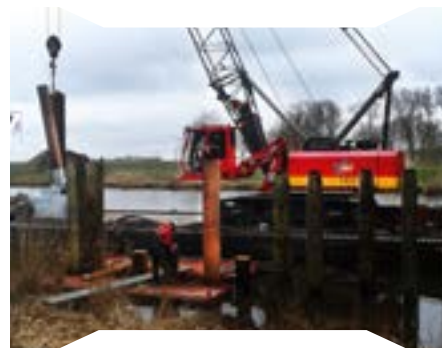
Bestaande palen renoveren met een nieuw bovengedeelte.