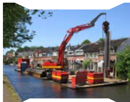
Damwanden in staal, hout en kunststof.