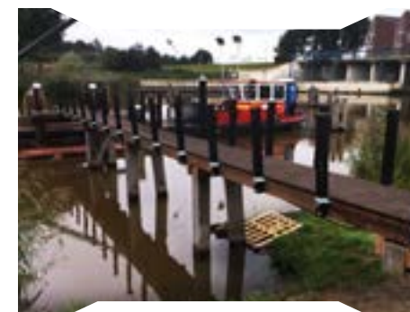
Loopsteigers en Loopbruggen.